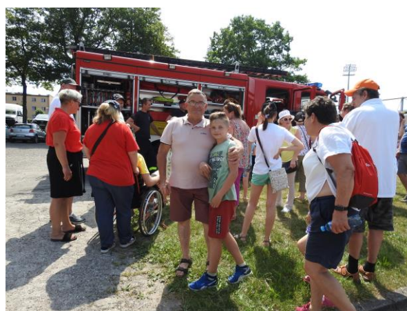
Zdjęcie nr 3 i 4. Występy artystyczne i wóz bojowy straży pożarnej.