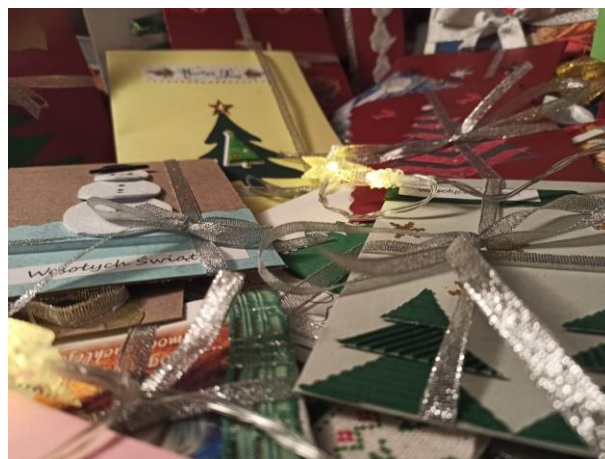
Zdjęcie nr 16 i 17. Kartki okolicznościowe przygotowywane na akcję.

Projekt Senio-RITA jest projektem o bardzo szerokim wachlarzu możliwości, którym możemy zaspokoić różne potrzeby mieszkańców miasta i gminy Bytów. Obserwujemy zacieśnianie się więzi sąsiedzkich, które mają wpływ na relacje między mieszkańcami, na zwiększenie się pomocy wzajemnej, a przede wszystkim na motywację do działania i spędzanie wspólnie wolnego czasu. To jest bardzo dobra recepta na samotność, ale też na dbanie o swoje zdrowie i swoją kondycję fizyczną i psychiczną. Uruchamiają się wartości motywacyjne, społeczne i kulturowe. Niejednokrotnie osoby otrzymujące wsparcie odzyskują „wiarę w system i namacalną pomoc” poprzez wszystkie działania.