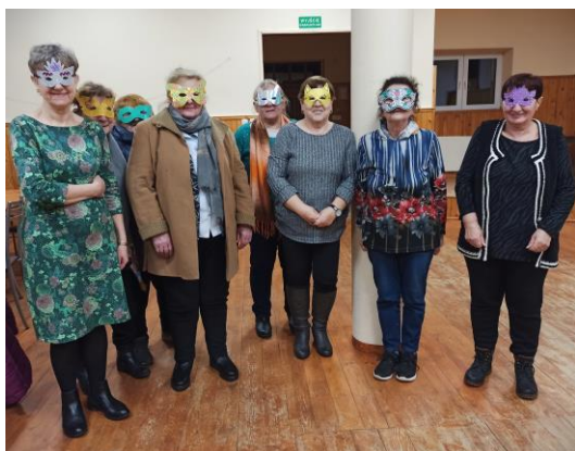
Zdjęcie nr 9. Zajęcia animacyjne Rękodzieło z elementami plastyki