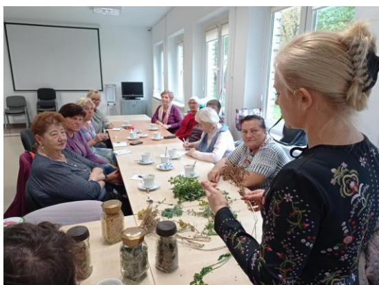
Zdjęcie nr 10. Zajęcia animacyjne – zielarstwo