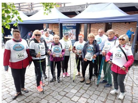
Zdjęcie nr 5 i 6. Wyjazd do teatru oraz Nordic Walking.