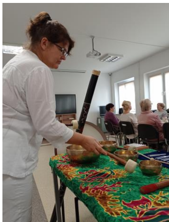
Zdjęcie nr 12. Zajęcia animacyjne relaksacja