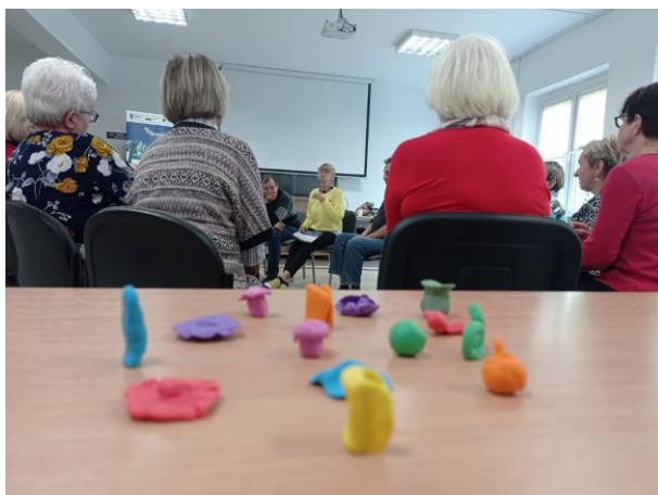
Zdjęcie nr 14. Zajęcia animacyjne coaching z elementami ruchu.