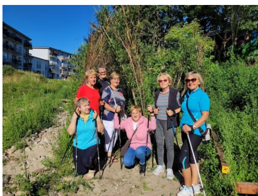
Zdjęcie nr 11. Zajęcia animacyjne społeczno-kulturalne