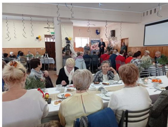
Zdjęcie nr 7 i 8. Ognisko integracyjne oraz spotkanie świąteczne.