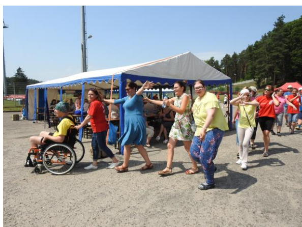
Zdjęcie nr 1 i 2. Piknik rodzinny na boisku bocznym MOSiR w Bytowie.