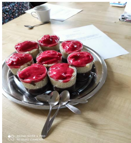
Zdjęcie nr 13. Zajęcia animacyjne kulinarne