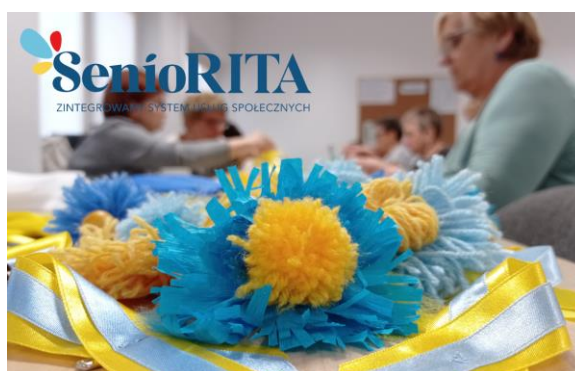
Zdjęcie nr 15. Przygotowania do koncertu charytatywnego.