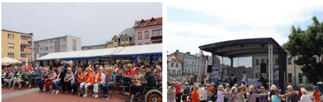
Zdjęcie nr 2 i 3. Piknik w dniu 05.07.2023

podsumowujący realizację projektu. Partnerom wręczono repliki statuetki wygranej w tegorocznej edycji konkursu SZTORM EUROPEJSKI – KAPITAŁ LUDZKI. W wydarzeniu uczestniczyli beneficjenci projektu, władarze gmin, przedstawiciele partnerów, Dyrektor Departamentu Europejskiego Funduszu Społecznego oraz Przewodniczący Sejmiku Województwa Pomorskiego. Każdy z partnerów samorządowych przygotował część artystyczną. Oba te wydarzenia miało charakter biesiady, w trakcie której był i poczęstunek i muzyka na żywo.