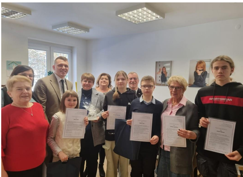
Zdjęcie nr 1. Spotkanie wolontariuszy w MOPS w Bytowie.