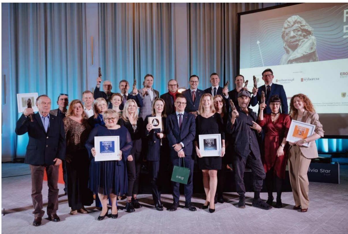
Zdjęcie nr 4. Pomorskie Sztormy 2023.