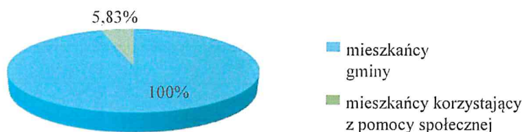
Wykres numer 1. Procentowy udział osób korzystających ze świadczeń z pomocy społecznej do ogółu liczby mieszkańców Gminy

Krąg osób korzystających z różnorodnych form wsparcia jest szeroki i odzwierciedla aktualne problemy lokalnej społeczności związane z zatrudnieniem, sytuacją zdrowotną i zabezpieczeniem społecznym.